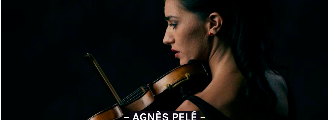
- AGNÈS PELÉ -

Violoniste, chanteuse, compositrice franco-argentine.